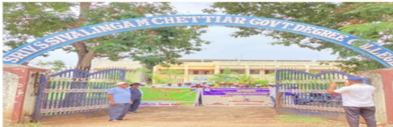
TFN | C Shekar Sullurpet: SV SSC Government Degree College, Sullurpet, inaugurated the celebrations for the 11th International Yoga Day with a grand program named "Yogandhra" on