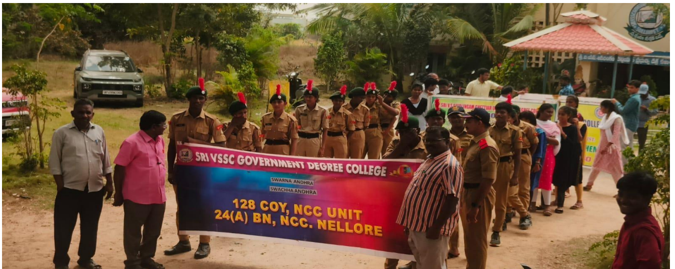
13. 'B' CERTIFICATE EXAMINATION